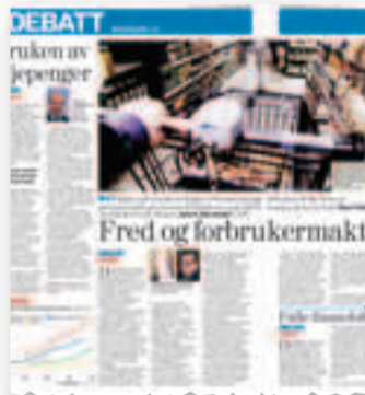
DN 25. januar

Disse innvendingene til matkjedeutvalgets forslag er fremsatt en rekke ganger, uten at matkjedeutvalget har imøtegått argumentene. Det kan skyldes at det er en logisk brist i