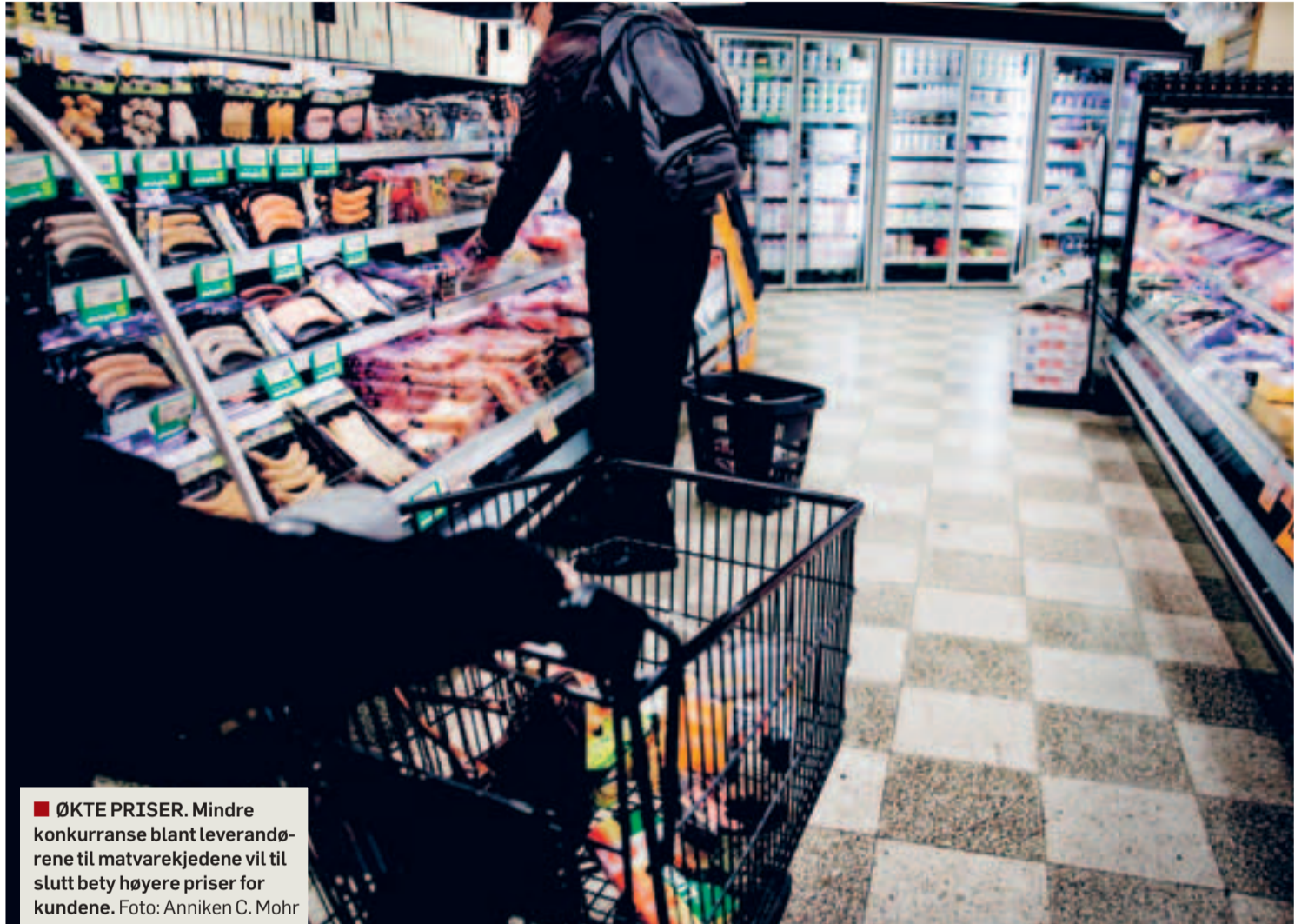
■ ØKTE PRISER. Mindre konkurranse blant leverandørene til matvarekjedene vil til slutt bety høyere priser for kundene.

Et eksempel gjelder begrensningene på kjedenes mulighet for å skifte ut produkter og leverandører (såkalt delisting). Hvis det blir vanskeligere for kjedene å bytte leverandører, må det bety at konkurransen mellom leverandørene blir svakere.