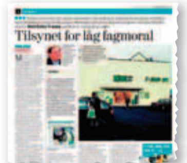
DN 9. februar.