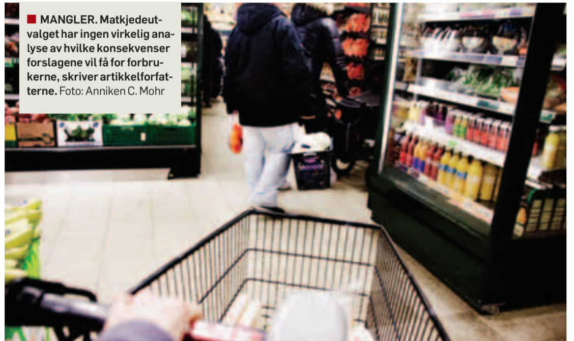
■ MANGLER. Matkjedeutvalget har ingen virkelig analyse av hvilke konsekvenser forslagene vil få for forbrukerne, skriver artikkelforfatterne.

Matkjedeutvalget mangler ikke bare et empirisk grunnlag