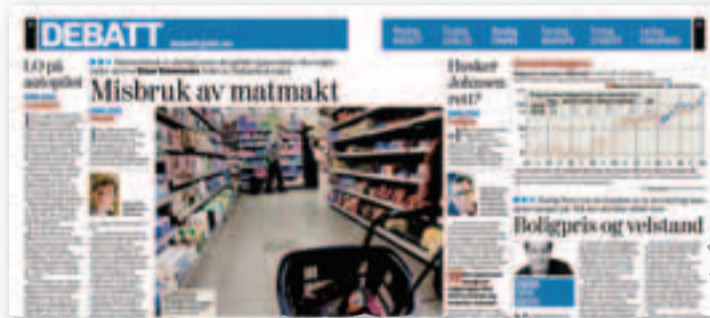
DN 8. februar.