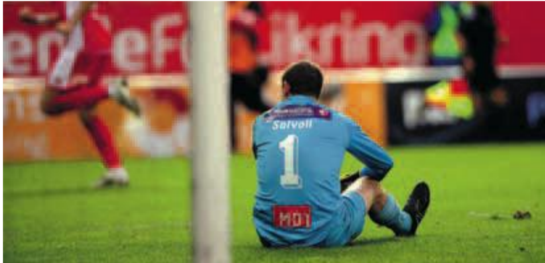
KAMPEN OM FOTBALLEN. I Norge hadde vi i 2009 og 2010 en fotballavtale som var helt unik sammenlignet med andre land, skriver innsenderne. Bildet er fra kampen mellom Brann og Hønefoss i Bergen ifjor.

Den nye avtalen for perioden 2013-2016 er en total reverseering av den konkurransen om enkeltkamper som det ble åpnet for i den avtalen som startet i 2009. Nå har Canal+ kjøpt rettighetene til både TV, web, IP TV og mobil for 6 av 8 kamper. Beløpet de har betalt er svært høyt, er vi blitt fortalt, og en høy pris er begrunnelsen fra Fotball Media AS for å si ja til dette tilbudet. Canal+ har i realiteten kjøpt seg enerett for de aktuelle kampene på alle relevante plattformer, og dermed stoppet mulighetene for at andre plattformer som IP-TV og web TV kan vokse frem som gode alternativer til vanlig TV. Ut fra et slikt