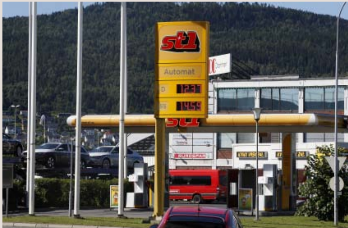
Hver mandag og torsdag formiddag settes pumpeprisen opp til selskapenes veiledende priser på alle landets mer enn 1600 bensinstasjoner. Vil Konkurransetilsynet slå seg til ro med status quo? spør artikkelforfatterne.

Ved å benytte et såkalt prisstøttesystem klarer bensinkjedene sentralt å styre prisene på hver enkelt bensinstasjon. Alle de fire store kjedene opererer med såkalte veiledende priser (tilgjengelig på hjemmesidene til tre av de fire store kjedene). Dermed vet kjedene sentralt også til hvilket nivå konkurrentene vil sette opp prisene på mandager og torsdager: De veiledende prisene. Selskapene kan da enkelt sjekke at konkurrentene